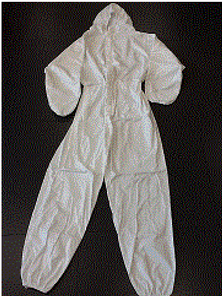
Entrada 11952_Amostra 17136

Artigos confeccionados com matéria-prima aprovada para dispositivos médicos reutilizáveis até 40 lavagens, no relatório 9924/2020-1.