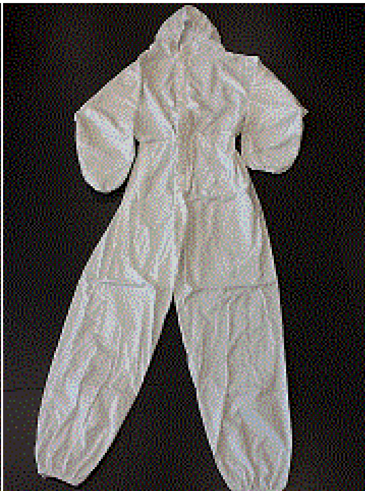
Entrada 11952_Amostra 17138